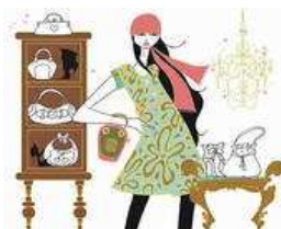
Image consultants can change lives

You've probably seen image consultants on TV transform the looks (1) of people who struggle to dress themselves suitably. You've seen the positive impact that a new image can have on people. And you've seen that there is a demand for image consultants that can make a person's outer body reflect their beauty inside.